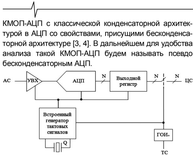
Рис. 3. Блок-схема АЦП со встроенным генератором тактовых сигналов с фиксированной частотой: ГОИ+ – генератор одиночных импульсов, возникающих по переднему фронту ТС; Q – кварц

Практическое применение псевдо бесконденсаторных АЦП имеет свои особенности. Дело в том, что любой генератор тактовых сигналов, как внешний, так и внутренний в АЦП, должен быть «кварцованным», чтобы удовлетворять определенным требованиям по «дрожанию» тактовых сигналов [1]. Из-за существующих ограничений по доступной номенклатуре кварцев в АЦП с частотой преобразования до нескольких гигагерц не удастся воспользоваться простой схемой непосредственной генерации тактовых сигналов с требуемой частотой (рис. 4).