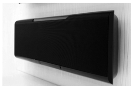
Рис. 1. IFA 2015: Yamaha YSP-5600 – звуковой проектор с невероятно объемным звучанием